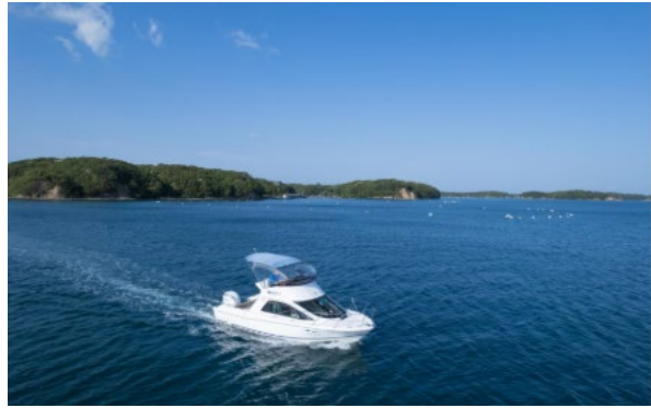
マリンタクシーを利用したチェックイン