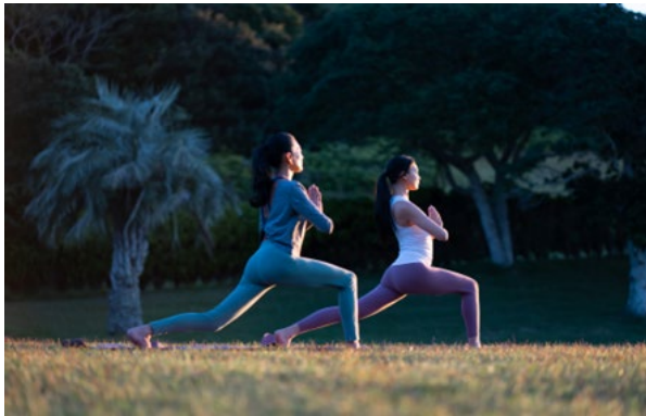
敷地内でのヨガ体験