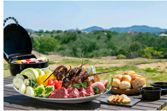
バーベキューイメージ