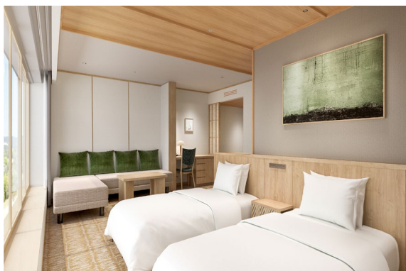
(仮)エグゼクティブ客室 イメージ

既存ホテルの一部客室も改装を実施。3階の和室12室は、NEMU RESORTらしい木の温もりと自然を感じるグリーンを基調としたデザインの「(仮)エグゼクティブ(46.8㎡)」に、2階の和室19室は、ベッドを備えた「(仮)スーペリア(46.8㎡)」に、それぞれ生まれ変わります。