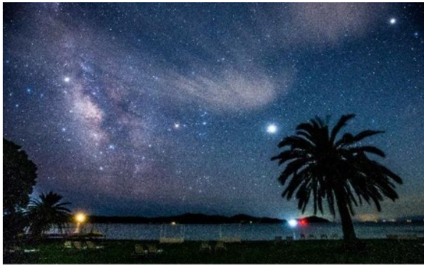
NEMU RESORT 敷地内から見える星空