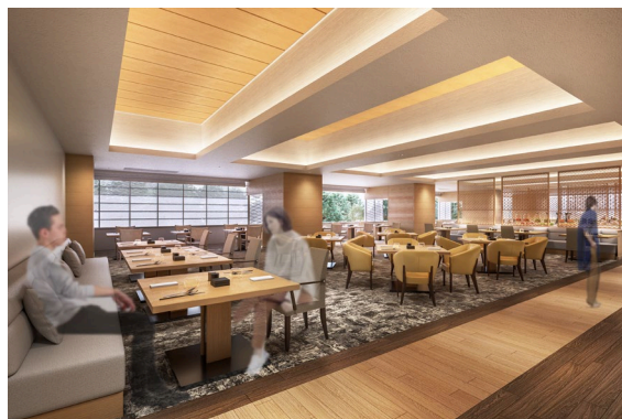
レストラン里海 内観イメージ