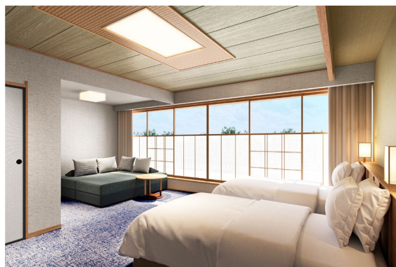
(仮)スーペリア客室 イメージ