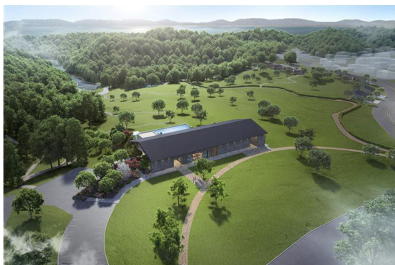
ヒルトップハウス 外観イメージ

NEMU RESORT内の「てふてふの丘」に、英虞湾と「里山水生園」を一望できる「ヒルトップハウス」を新設いたします。プールやジェットバス、キッズプールを備え、テラスでは心身をリフレッシュするヨガ体験や様々なイベントの開催を予定しています。また「ヒルトップハウス」内には英虞湾を望む絶景の中で、団体パーティー等を行うことのできる「ダイニング里山」を新設いたします。