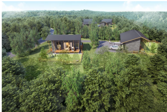
フォレストヴィラ 外観イメージ

既存ホテルの一部客室も改装を実施。3階の和室12室は、NEMU RESORTらしい木の温もりと自然を感じるグリーンを基調としたデザインの「(仮)エグゼクティブ(46.8㎡)」に、2階の和室19室は、ベッドを備えた「(仮)スーペリア(46.8㎡)」に、それぞれ生まれ変わります。