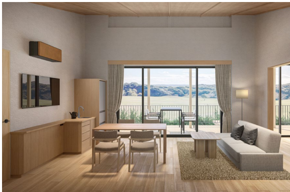
ヒルズヴィラ 室内イメージ

伊勢志摩の自然を最大限に体感できる客室として、81㎡(ウッドデッキ含む)のヒルズヴィラ8棟・フォレストヴィラ10棟を新設いたします。三重県産の木材を使用したヴィラでは、豊かな自然に包まれた、静かなひとときをお過ごしいただけます。各ヴィラにはビューバスやテラスを設け、テラスでは三重県産の食材をメインとしたバーベキューをお楽しみいただけます。新設するヴィラのうち2棟はファミリーやグループに最適な2bedroom(118㎡)とし、既存のフォレストヴィラの8棟は全て愛犬と一緒にご宿泊いただける「with Dog」へと生まれ変わります。各棟へは乗用車の乗り入れもでき、各棟専用のランドカー(移動用カート)で、広大なNEMU RESORTの敷地内を快適にご移動いただけます。