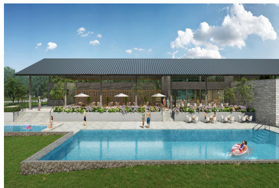
ヒルトップハウス メインプールイメージ