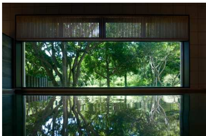
天然温泉の大きな窓の向こうには NEMU の森