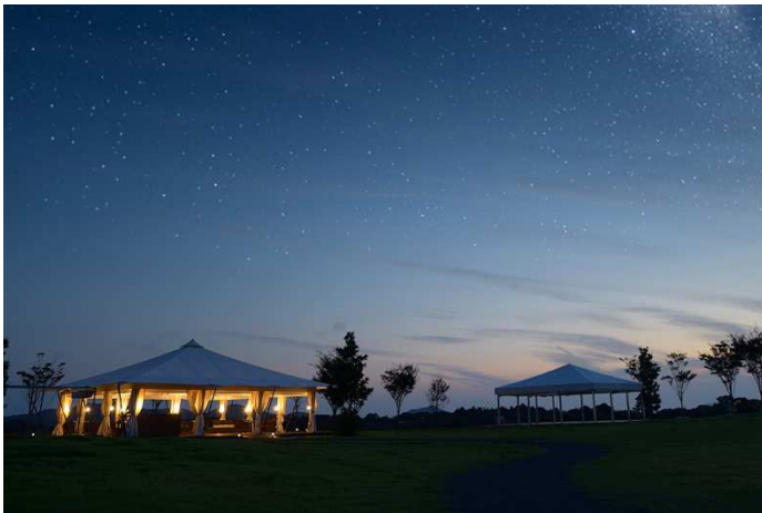
NEMU ならではのグランピングが愉しめる「里山ラウンジ」