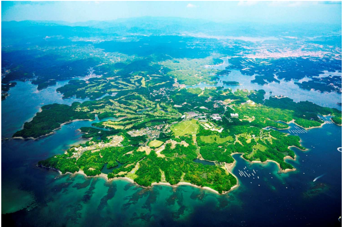
都会の喧騒から離れた豊かな伊勢志摩国立公園内に立地する「NEMU HOTEL & RESORT」全景

所在地 〒517-0403 三重県志摩市浜島町迫子 2692 番地 3 (伊勢志摩国立公園内) 宿泊施設 HOTEL NEMU(客室 60 室) その他施設 ゴルフクラブ、マリーナ、温浴施設 交通 [鉄道] 近鉄鵜方駅からタクシー約 10 分、 近鉄賢島駅から無料送迎バス約 15 分、賢島港からマリンタクシー約 10 分 [車] 伊勢自動車道玉城インターより約 50 分