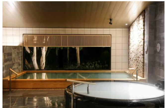
NEMUの自然の恵みを全身に取り込める温浴施設「恵みの湯」