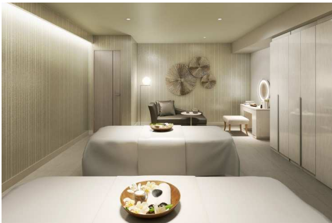
真珠をイメージした2ベッドトリートメントルーム(イメージ)