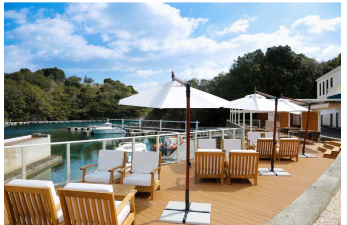
潮風を感じながら寛げるテラスのある「マリーナ」