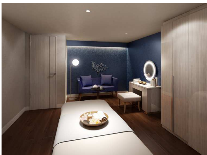
NEMU の海をイメージした1ベッドトリートメントルーム(イメージ)