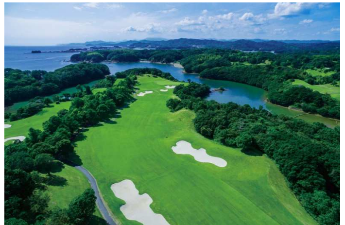
シーサイドリゾートコース「NEMU GOLF CLUB」