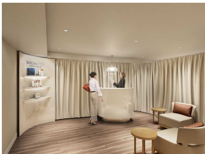
トリートメントサロン ウェイトイングルーム(イメージ)