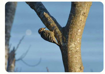
コゲラ (キツツキの仲間)

コツコツと聞こえたら、木を叩きエサ(昆虫)を探している時。そおっと木陰をのぞくと出会えるかも。