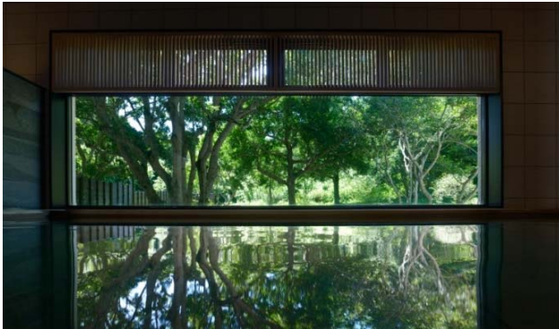
天然温泉の大きな窓の向こうにはNEMUの森