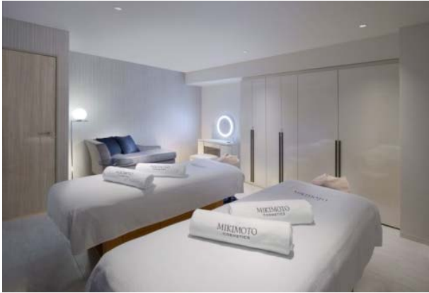
真珠をイメージした2人用ルーム