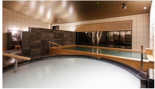
手前は「真珠の湯」、奥は「潮騒の湯」