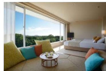
客室 デラックスルーム