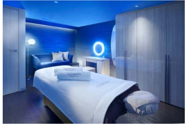
NEMUの海をイメージした1人用ルーム