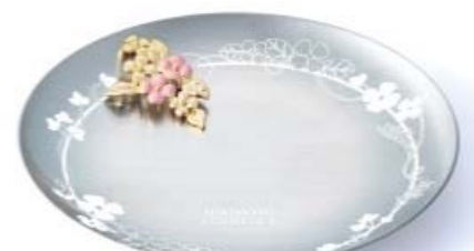
オリジナル トレイ