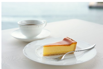
チーズケーキセット(イメージ)

期 間： 2018年4月8日～7月31日 ※除外日7月27日 料 金： 3名1室・1泊夕朝食付き お一人様あたり 19,000円～ ※ご夕食：和食・洋食からお選びいただけます。 ※ご朝食：和洋buffet。2017年金賞受賞「伊勢海老ビスクスープ」もご賞味いただけます。 特 典： ご滞在中、カフェ・ラウンジでチーズケーキセットをご利用いただけます。 ご 予 約： 鳥羽国際ホテル 予約専用ダイヤル 0599-25-4121 (8:00～20:00)