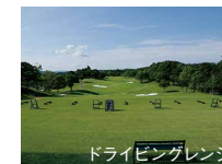
ドライビングレンジ

◎クラブ、シューズ無料レンタルをご用意しております ※当日でも空きがあれば練習できます