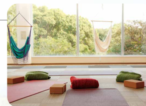
ガーデンルーム (専用ヨガルーム)

※中学生以上対象 ※催行人数／2～20名 ※要予約／3日前まで (予約が入っていれば当日お申込みできます) ※冬季は屋内のガーデンルームにて。