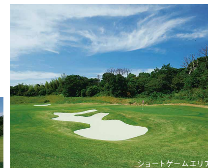
ショートゲームエリア